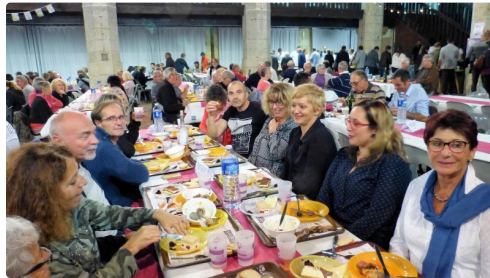
une salle bien remplie, 800 couverts servis.