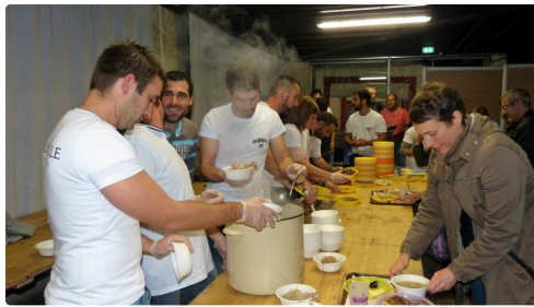
les jeunes agriculteurs au service