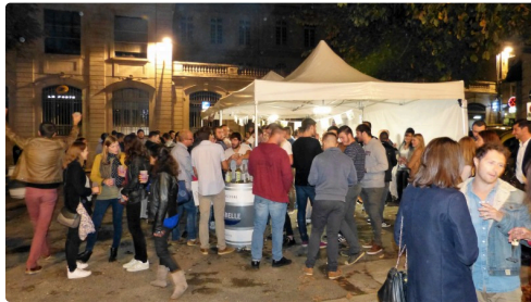
l'ambiance dehors aussi