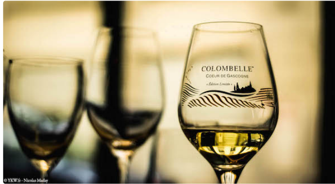
AUCH ; La Colombelle 2017 est arrivée

La Colombelle 2017 est arrivée, une merveille.