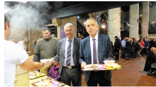
Mr le Maire et Mr le Sénateur à la dégustation