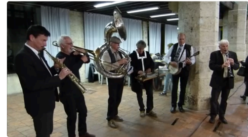
les gascons laveurs pour la fête