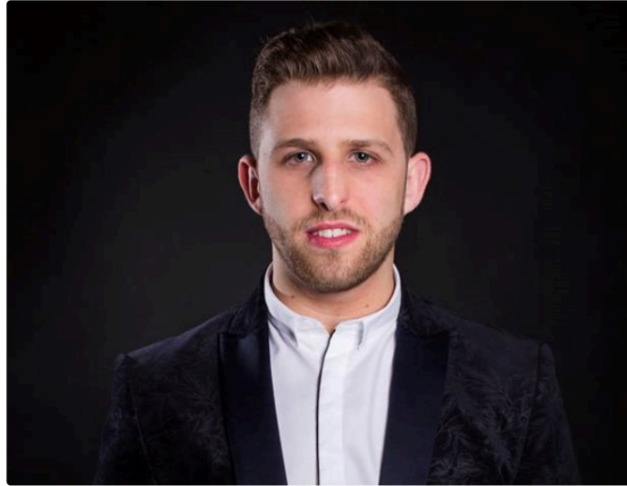
Lecture - Festival "Bizarre"

Exposition, lectures et concert pour l'ouverture