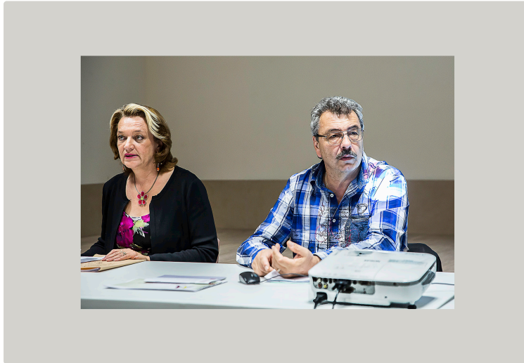
Maulichères – La CCAA en plein travail

Nouvelles compétences, retour à la semaine de 4 jours ?