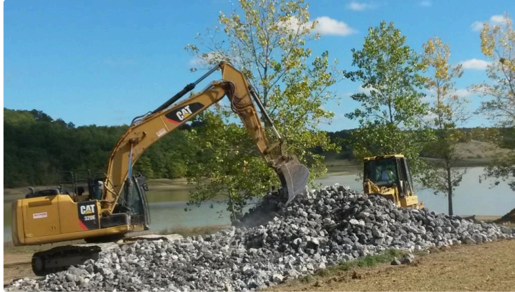
Saint-Pierre-d'Aubézies - Les travaux de la digue ont commencé

Prévus l'an passé mais repoussés faute de mauvais temps, les travaux d'enrochement de la digue du lac Saint-Jean ont enfin pu débuter ces jours-ci avec des conditions climatiques idéales.