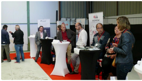
Les échanges ont eu lieu autour d'une table pour chacune des entreprises.