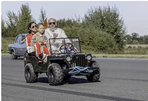
Mini car jeep