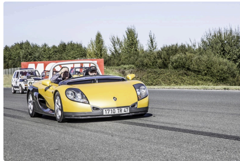
Spider Renault