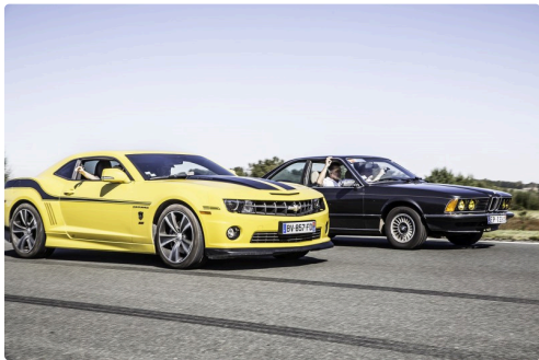
Chevrolet Camaro et BMW v