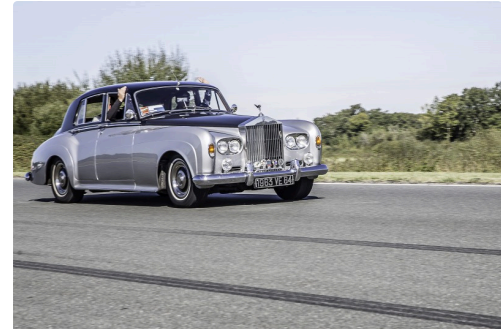
Rolls Royce