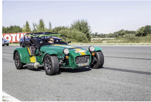
Lotus Seven