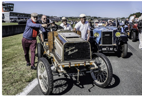
La De Dion Bouton passe en tête