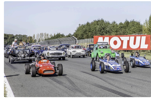
Une immense variété de modèles