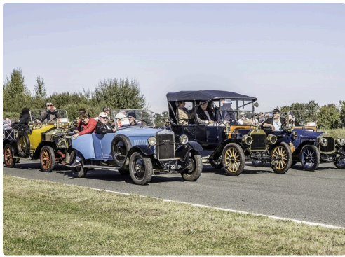
Les ancêtres en 1re ligne