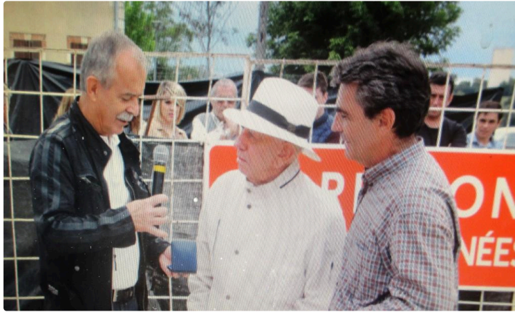
Hommage à Victorino