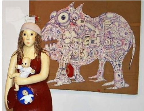
Condom – Dernière exposition avant l'hiver

La saison artistique à l'Espace Saint-Michel avait débuté plus tôt cette année, avec l'exposition de Jean-Paul Chambas en février.