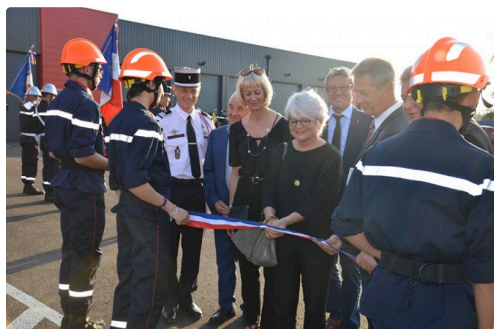
pompier centre vic 1.jpg