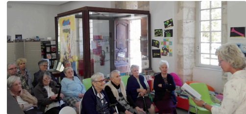
Le public attentif à la lecture