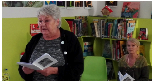
Capture d'écran (187).png