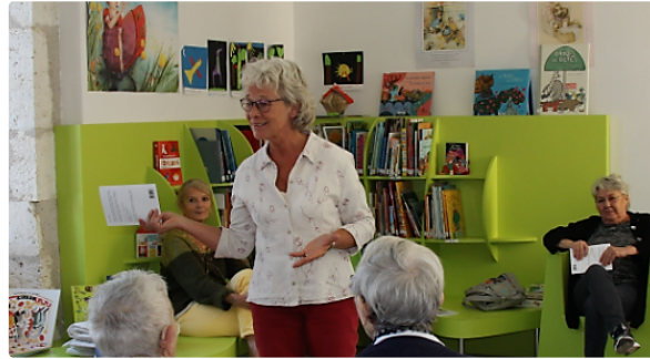
Saint-Clar - A la découverte de "Souvenances"

Il y avait de l'émotion dans les regards à la médiathèque de Saint-Clar mercredi, beaucoup d'émotion.