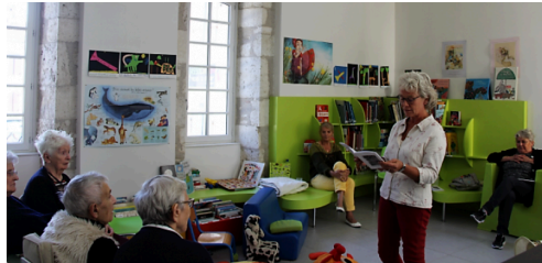
Lecture d'extraits de "Souvenances"

Le public peut se le procurer auprès de l'association LALO http://www.lalo-association.org