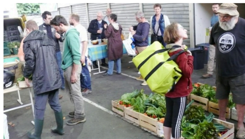
Livraison des paniers.