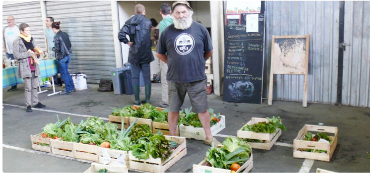
Heureux les Amapiens du "Chou chinois"

Ils tiendront un stand samedi 30 septembre sur le parvis de la salle polyvalente du Garros