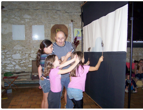
Explication du mouvement accompagné du cri de l'animal présenté