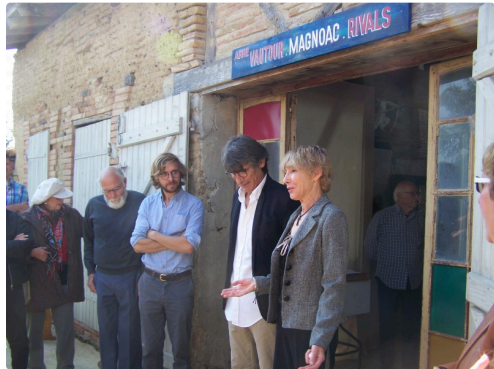
Présentation des trois artistes

L'exposition est découverte au lieu dit « Le Soulès » près de Samatan, jusqu'au 8 octobre