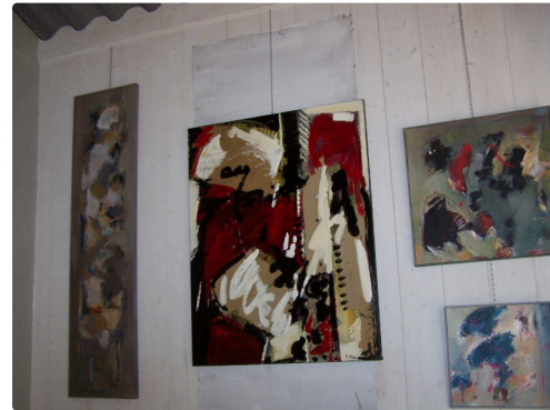
Mouvements, rythmes, des oeuvres de Anne Vautour