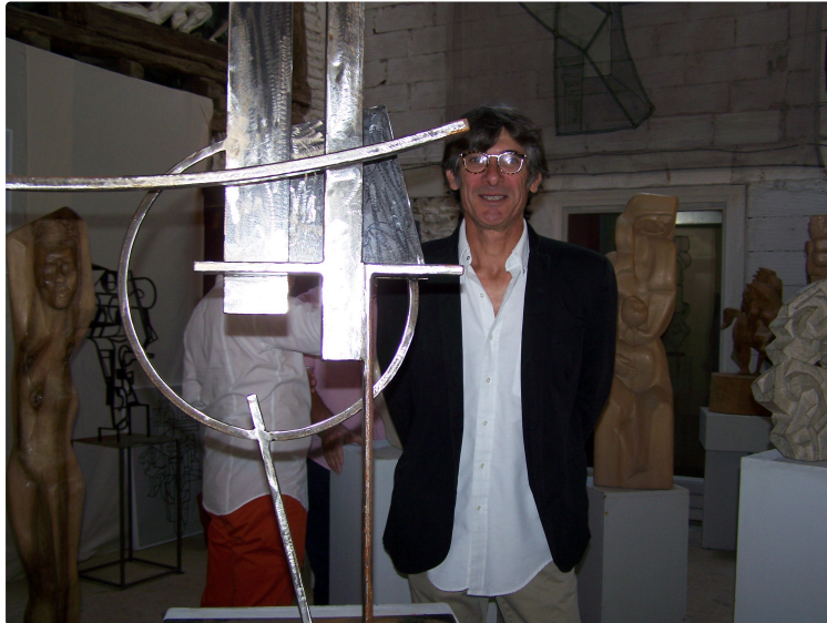
Vernissage d'une exposition réunissant trois artistes à Samatan

Troisième édition réussie par le sculpteur Jean-Patrick Magnoac