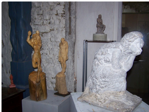
Sculptures de Vincent Rivals