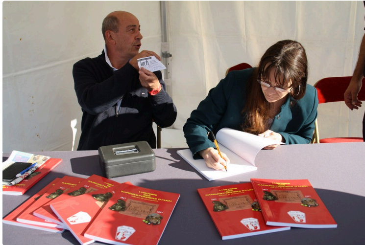
L'histoire des Sapeurs pompiers d'Auch