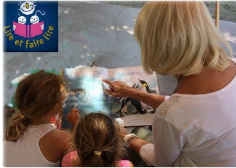
Lire et faire lire - La Ligue de l'Enseignement du Gers cherche des bénévoles et des structures éducatives

Lire et faire lire est un programme national d'ouverture à la lecture et de solidarité intergénérationnelle.