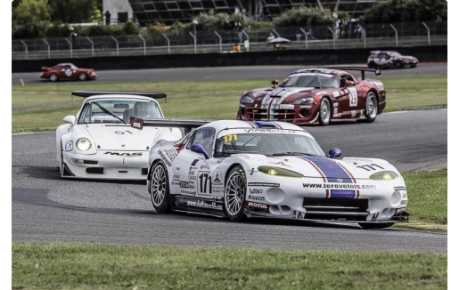
GT Classic course 2 : 1bis le n°171(Franck Morel) devant le n°51