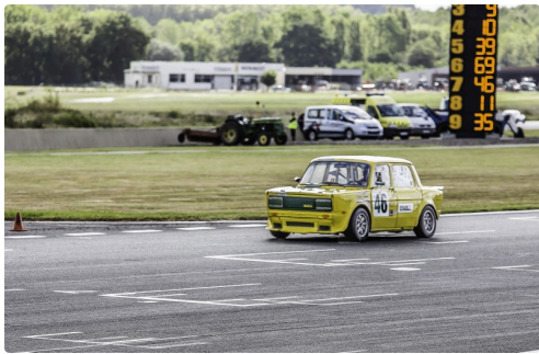
Maxi 1000 course 2 : la Simca Rallye n°46