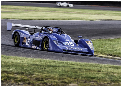
Protos course 2: le n°15 est 2e