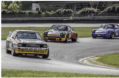
GT Tourisme Asave Saloon Cars course 2 : le n° 89 est 2e