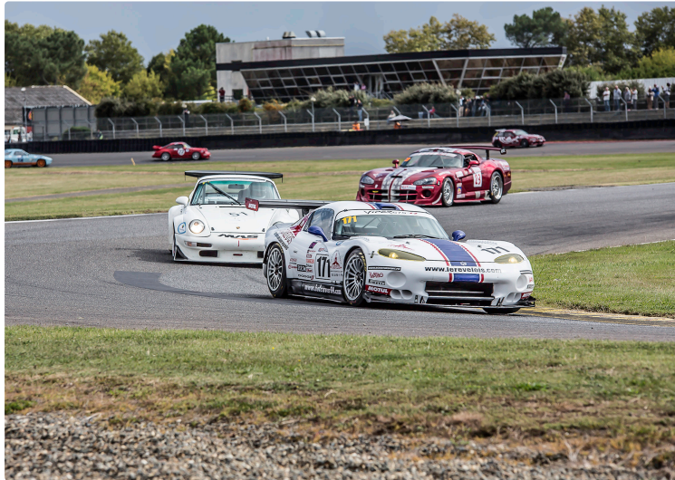
Nogaro - Historic Tour : une 2e belle journée de courses

Ah, ces beaux prototypes, ces belles Lotus et ces Caterham mignonnes à croquer ! Et toutes les autres ! Ce week-end des samedi 9 et dimanche 10 septembre aurait mérité plus de spectateurs. La pluie menaçante, qui n'est tombée que le matin et moins que la veille, en a dissuadé beaucoup. Ils ont été beaucoup plus nombreux dimanche que samedi, mais, au total, leur nombre a baissé de 35 % par rapport à 2016, à 4510.