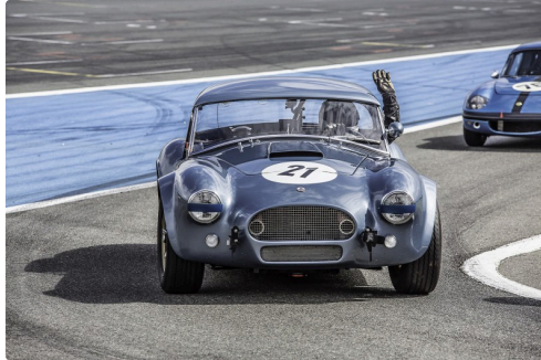
Asave Racing 65 course 1 : le vainqueur n°21 rentre