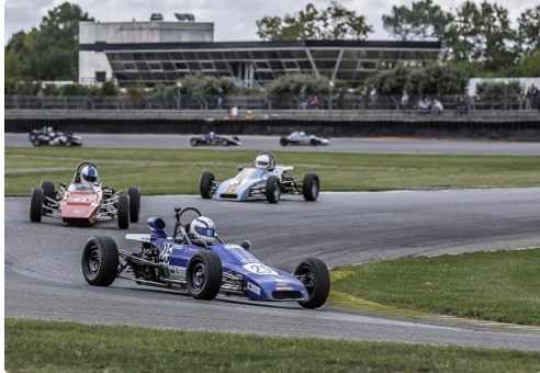
Ford Historic course 2 : le n°25 en tête