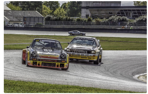
GT Tourisme Asave Saloon Cars course 2 : le n° 89 Franck Morel) double le n°1