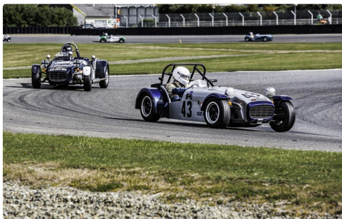
Lotus course 2 : le n°43 en tête