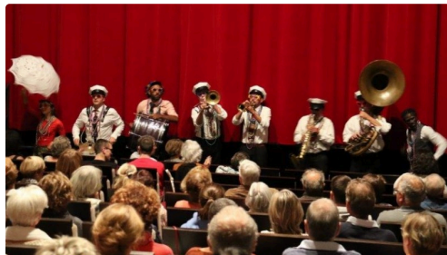
Arrivée en fanfare