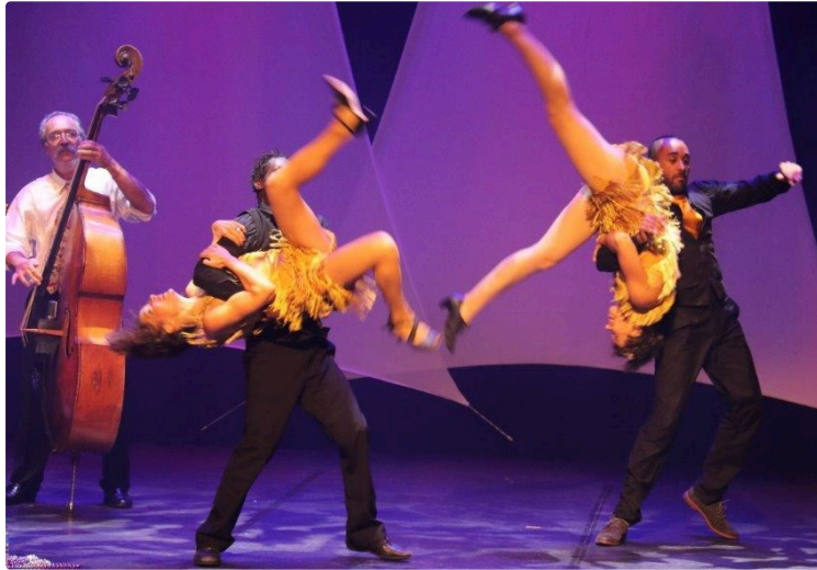
Soirée Jazz New Orléans au Théâtre de Condom

Après une entrée en fanfare des musiciens dans la salle, les spectateurs du Théâtre ont pu apprécier le groupe Oyster Brother lors de la soirée "A night in New Orleans" de samedi. Des virtuoses de Jazz New Orleans, accompagnés par le groupe de danseurs The Funky Swing Dancers qui, dans une chorégraphie tantôt jazzy, tantôt moderne, ont bien souvent soulevé l'enthousiasme du public avec des applaudissements fournis.