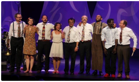
Un salut final très applaudi