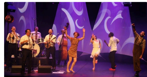
Joie et bonne humeur