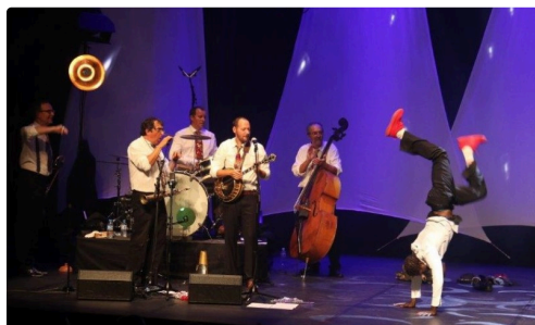
Beaucoup de souplesse