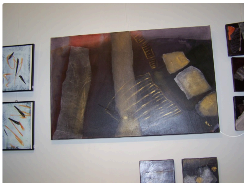
Collages et couleurs nuancées.....