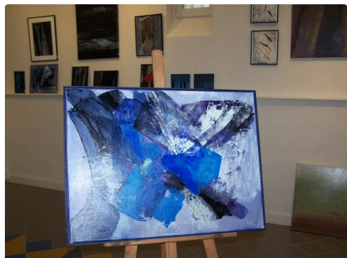
Une toile qui a obtenu le Premier Prix à Saint-Laurent -Lolmie (Lot)

Heures d'ouverture : lundi ( sur rdv) mardi 16h /19h mercredi (idem) jeudi 10 h 12 h30 s vendredi 16 h/19 h samedi 10 h/ 19h et 16h/19h dimanche sur rdv