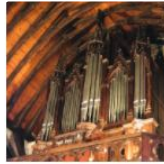
Les amis des orgues