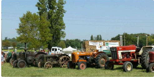
Il y avait aussi de vieux tracteurs.