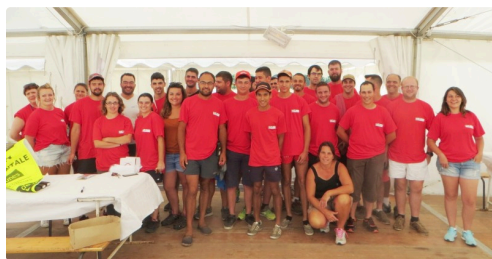
Le groupe des bénévoles.

Un immense merci aux équipes des cantons de Gimont-Saramon et Lombez-Samatan et à tous les bénévoles JA du département qui se sont mobilisés chaque jour pour offrir au public ce week-end d'immersion dans l'agriculture et la gastronomie gersoise. Merci également à tous les partenaires, exposants, concessionnaires et acteurs locaux d'avoir bravé la chaleur et pour leur contribution sans laquelle Gascogn'Agri ne saurait être une si belle rencontre.