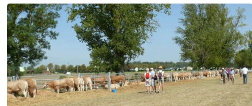
Une belle brochette d'animaux avant de défilier ...