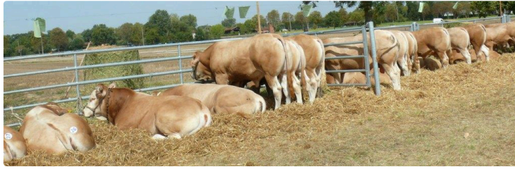
Gascogn'Agri : Un bilan flatteur avec 5 000 visiteurs et toujours les mêmes prouesses depuis 7 ans

Cette année encore les Jeunes Agriculteurs du Gers ont accueilli à Gimont les 26 et 27 août leurs partenaires et le grand public autour d'animations en tout genre. Concours Départemental de Labour, démonstrations de matériel agricole et de labour à l'ancienne (vieux tracteurs et chevaux de trait) concours des Blondes d'Aquitaine, mini-ferme et jeux pour les enfants, soirée en plein air et Courses landaises !