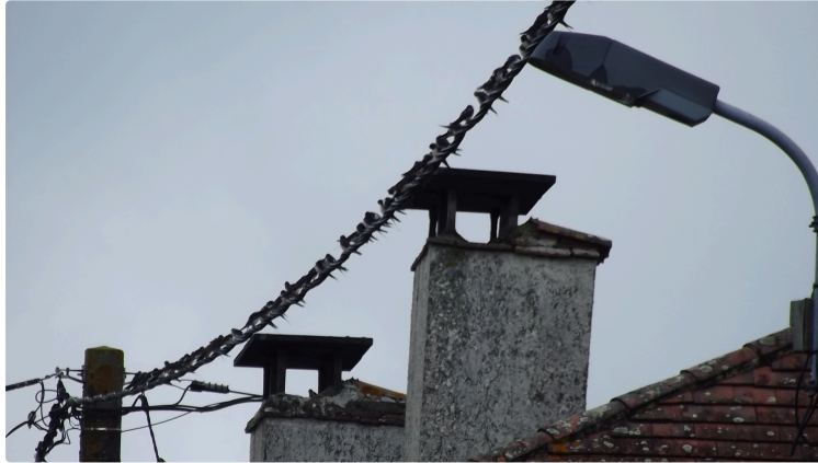
Les hirondelles en conciliabule

Elles préparent déjà la grande tranhumance