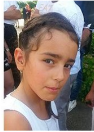
Appel à témoins lancé par les gendarmes de l'Isère