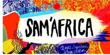
Festival Sam'Africa du 1er au 3 septembre

Le 19e festival interculturel africain fêtera l'Afrique à Samatan les 1, 2 et 3 septembre, avec pour thème « La culture et le nomadisme ».