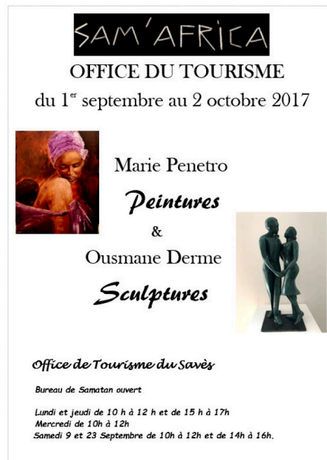
Affiche Sam'Africa septembre 2017.jpg