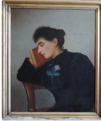
"Chut ....ma femme dort"

Un tableau inconnu de Jean-Baptiste Duviau retrouvé chez un brocanteur