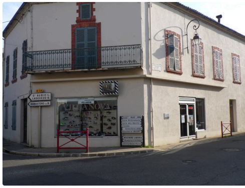
C'est ici qu'avait été créée la première épicerie de Plaisance