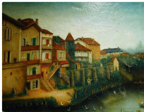
La berge de la rivière en 1891