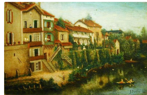
La même en 1936 la tour en bois victime d'un incendie a disparu