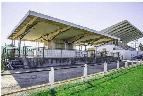
La buvette et tribune pour handicapés (des plaques de verre remplaceront la balustrade) ; état le 21 août