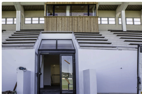
En haut le kiosque pour filmer les matchs et pour la presse (le 21 août)