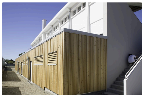
L'arrière des tribunes, des vestiaires et de l'infirmierie (état le 21 août)