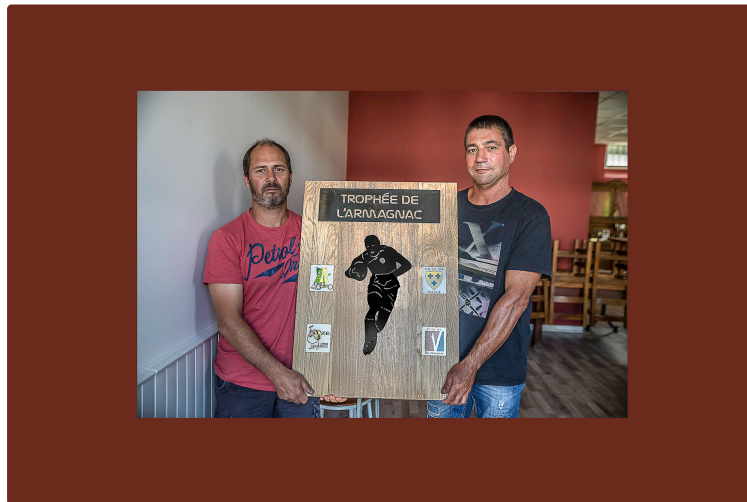
Nogaro – Une belle journée de rugby

Pour le Trophée de l'Armagnac le 2 septembre