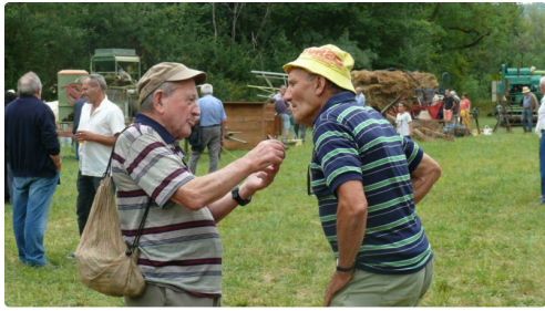
Des échanges sur l'ancien temps ...