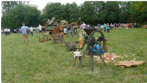
Les vieux outils.