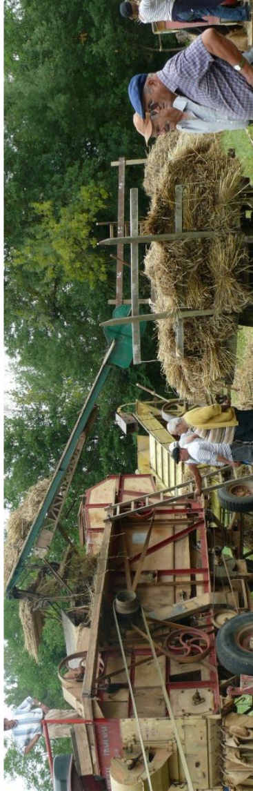
Auterrive : Le battage à l'ancienne a retrouvé des couleurs

Même si la matinée a été tronquée par la pluie, cette journée de battage à l'ancienne du 15 août a retrouvé tout son lustre dans l'après-midi à commencer par le repas des « battusaïres » qui a connu un gros succès puisqu'affichant complet. Puis sur le coup de 15 heures les animations reprirent avec le fameux dépiquage, et les nombreuses expositions de matériels agricoles anciens.