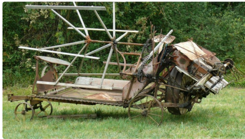
La faucheuse -lieuse.