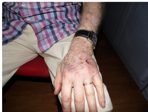
La main porte la trace du coup de chaise