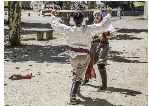
Duel au bâton