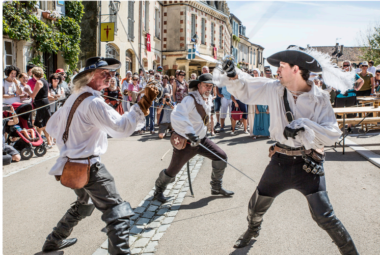
Lupiac – Duels au soleil

Ce dimanche 13 août, à Lupiac, la foule des visiteurs admire les nombreux duels de mousquetaires, de gardes du cardinal de Richelieu et même des rencontres à la canne.