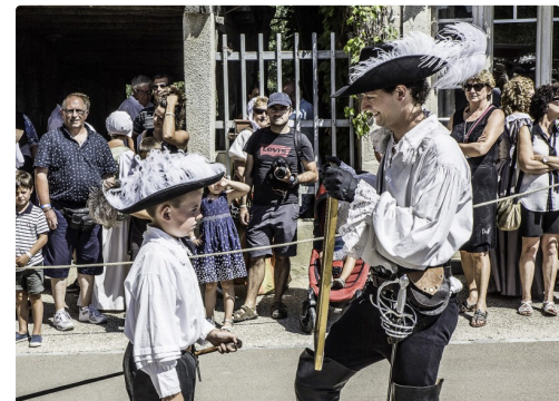
Un jeune élève de l'école d'escrime jure d'appliquer le règlement