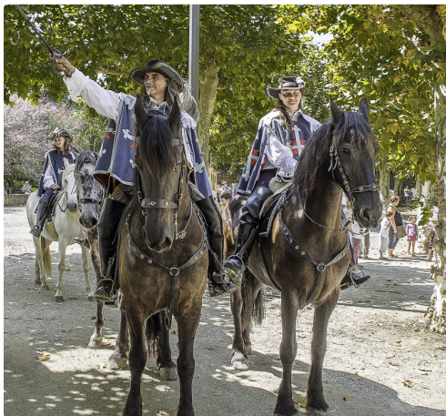
Arrivée de d'Artagnan et de sa suite

Dans un prochain article, on verra des artisans et la vie à Lupiac un jour de foire du temps de d'Artagnan.