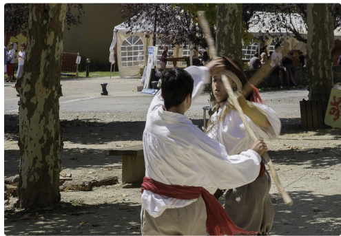
Suite du duel au bâton