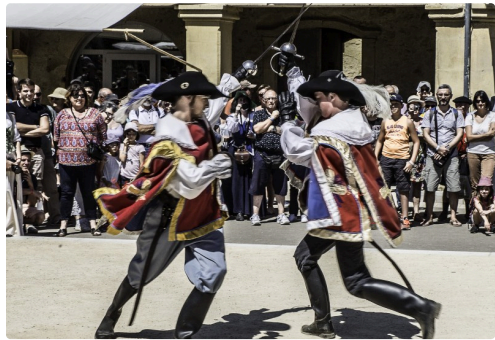
Duel de gardes du cardinal par la troupe Calida Costa