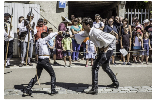
Suite de ce duel