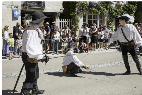
"Duel" à 3 chez les Lames lupiacoises