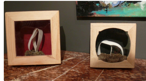
Sculptures de Arturo Gomez Sanchez.