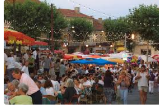
Vic-Fezensac - Troisième marché de nuit