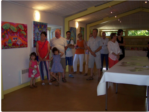
Des invités sous le charme de oeuvres