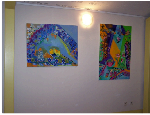
l'univers coloré de Marthe Huigens