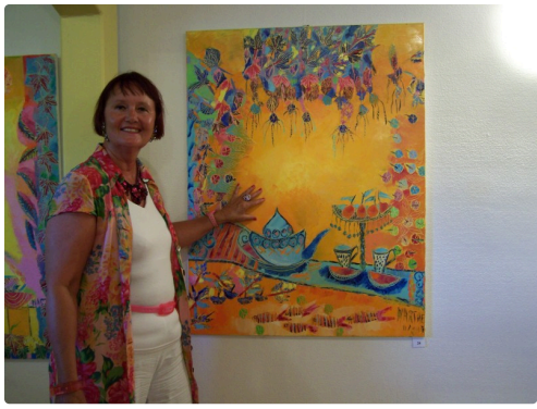
l'artiste devant une de ses oeuvres