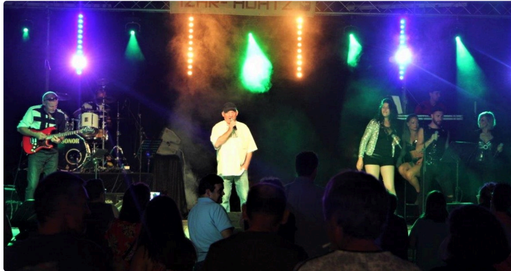
Condom - Belle réussite pour les Fêtes de la Bouquerie version 2017.

Toute l'équipe des bénévoles peut se féliciter de ces deux jours de fêtes.