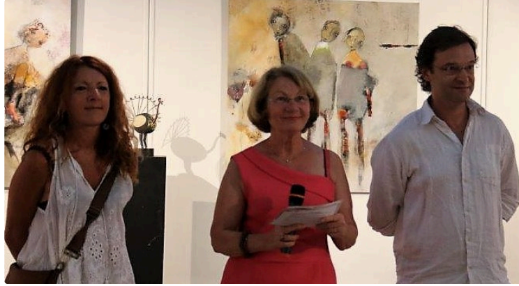
Condom - "Que le rêve l'emporte"

L'Exposition anglaise a fermé ses portes le 31 juillet à l'Espace Saint-Michel, pour laisser place à trois artistes venus présenter « Que le rêve l'emporte ».