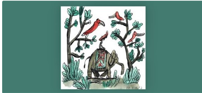
L'Office de Tourisme Bastides de Lomagne propose un voyage illustré et guidé par une guide conférencière.

Voici la deuxième visite guidée suite aux expositions des oeuvres de Benoit Jacques (illustrateur) dans différents endroits de notre communauté de communes.