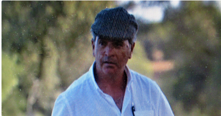
Taoumachie à Riscle - Novillada piquée

Le retour des Albasserada portant le sceau de Fabrice Torrito