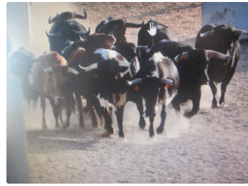
Groupe d'Albasserada avant l'embarquement

Toro d'Albasserada Helvetica (5ans) sera combattu le 15 septembre à Tafallia