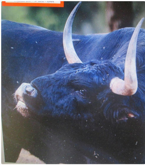
Un toro d'Albasserada : cornes astifinos