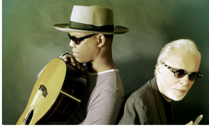
Jazz in Marciac – Eric Bibb & Jean-Jacques Milteau

Eric Bibb, large pork pie hat vissé sur la tête, annonce d'emblée que la soirée sera dédiée à la musique de Leadbelly. Il ne le dit pas, mais c'est en ce jour anniversaire, le 1er août 1934, que le bluesman sort de prison.