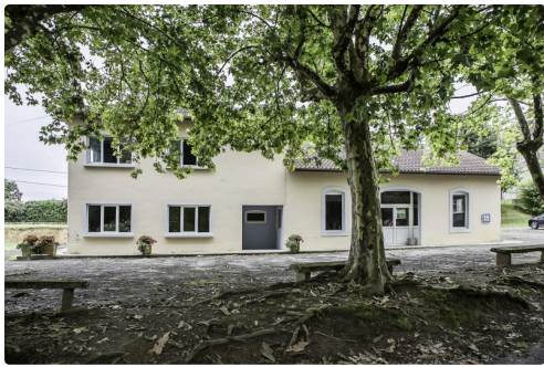
Le superbe bâtiment de la salle des fêtes et de la cantine de l'école