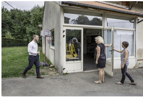
Visite de la cantine et...