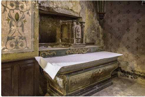
Le maître autel remis dans une chapelle latérale avec le tabernacle