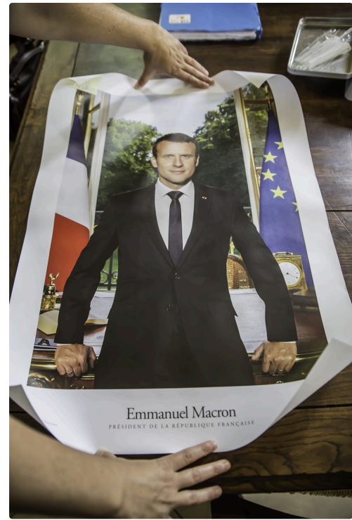
Photo d'Emmanuel Macron remise par le sous-préfet