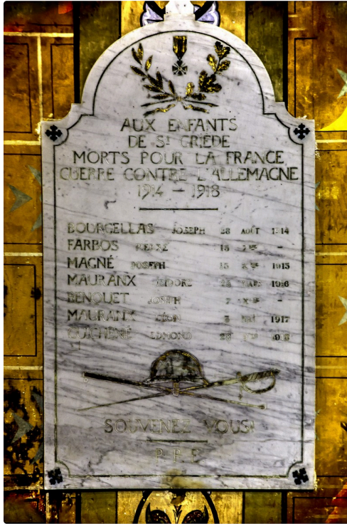
Plaque monumentaux morts de la "Guerre contre l'Allemagne" dans l'église et...