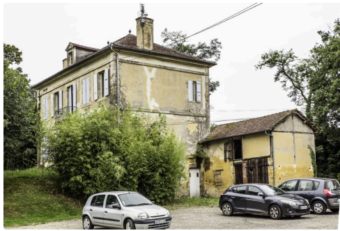
L'ancien presbytère destiné au logement communal