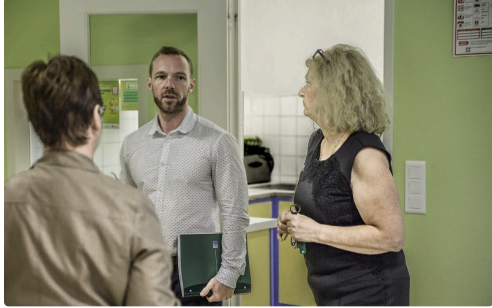
À la cantine