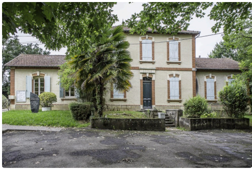
Bâtiment mairie + école + logement communal