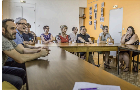
Les commerçants lors de la réunion