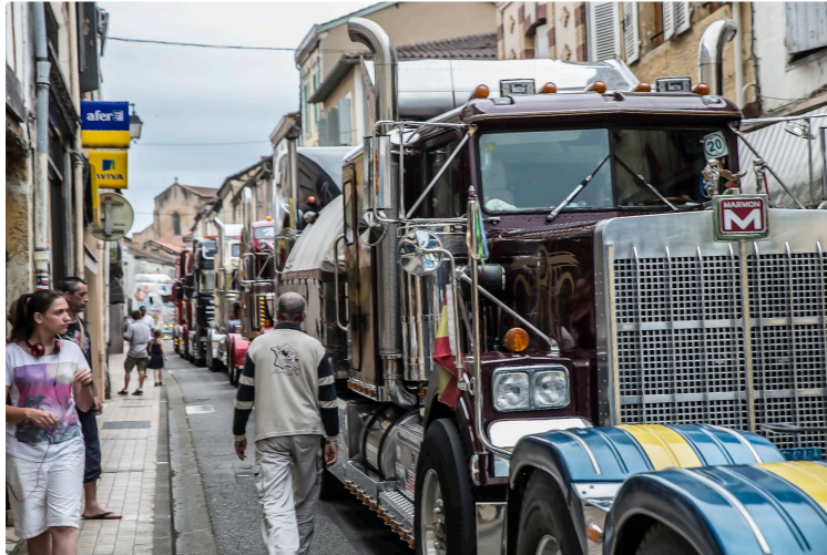
Nogaro – La rue Nationale devient rue de la République

Elle sera aménagée avec priorité aux piétons