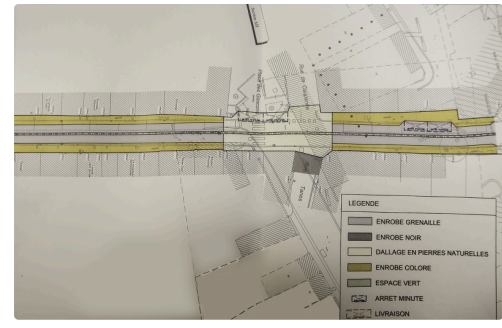
Plan partie basse