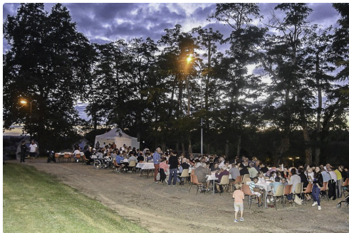
Le repas festif