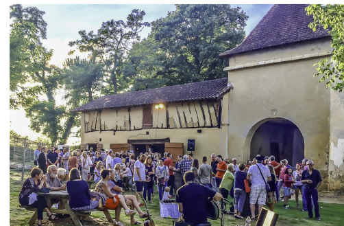
La fête devant le bâtiment annexe du Castet