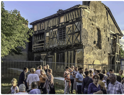
Au pied du Castet