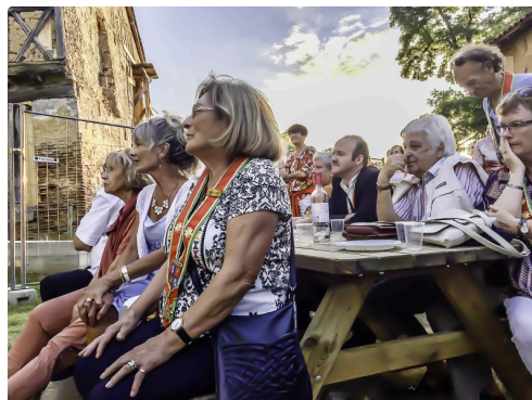
Dans l'assistance