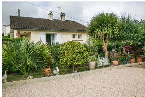
Dans le même domaine