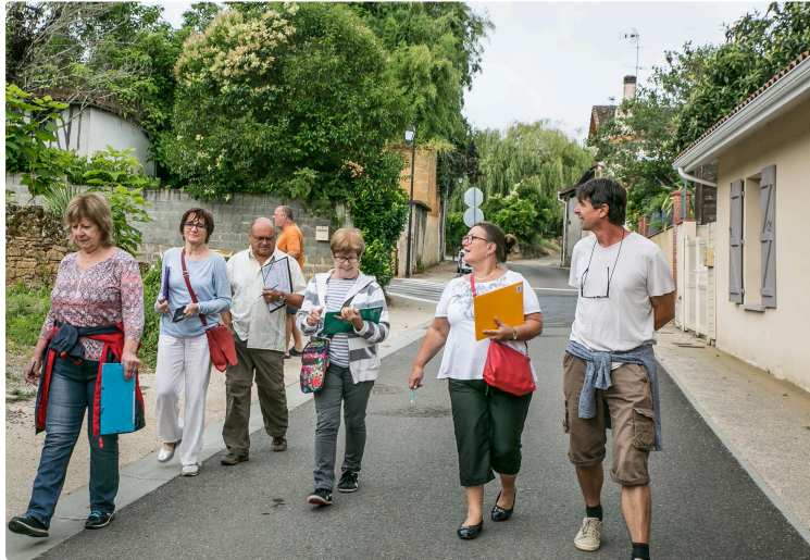
Nogaro – Concours de fleurissement des jardiniers amateurs