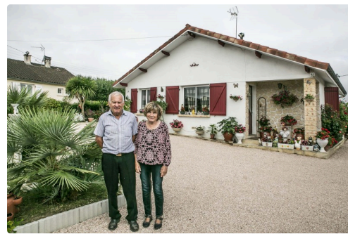
Maison et terrasse fleurie