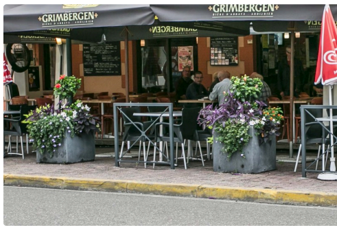
Brasserie Le Progrès