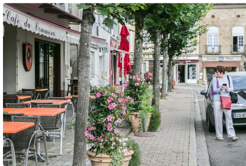
Le Café du commerce

N.B. - La photo du haut représente le jury en action.