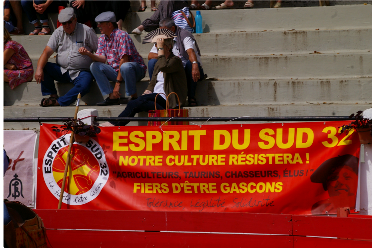
Seizième journée taurine de Plaisance

Très gros succès de toutes les animations proposées