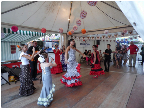
photos de cette belle journée taurine de Marcel Lavedan. Droits Réservés