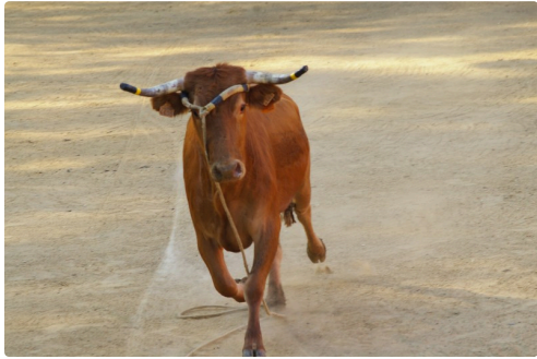
Et une jeune Castaño