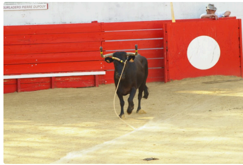
Une noire de la D A L