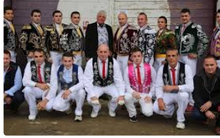
Club des Amis de la Course Landaise de Plaisance

Première Course Landaise jeudi soir 13 juillet à 20 h 30