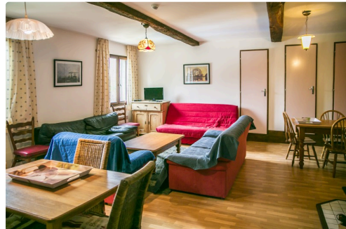
Le salon d'un des appartements