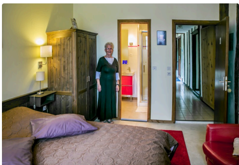
Une chambre d'appartement