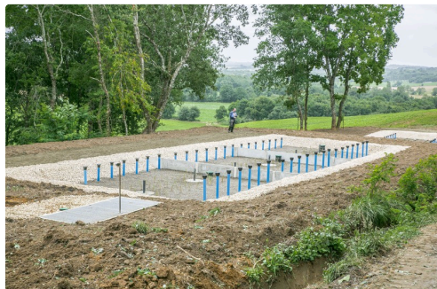
La station d'assainissement qui vient d'être achevée

(1) Site ( http://www.domaine-castex.com/ ), adresse courriel ( info@domaine-castex.com ), tél. : 05 62 09 25 13. (2) Le domaine offre 50 emplacements, 7 chalets en bois, 2 mobilhomes, 5 chambres d'hôte, 2 gîtes et un bâtiment pour les sanitaires.