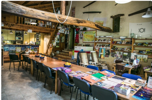
La Salle à manger principale avec le bar et la mezzanine