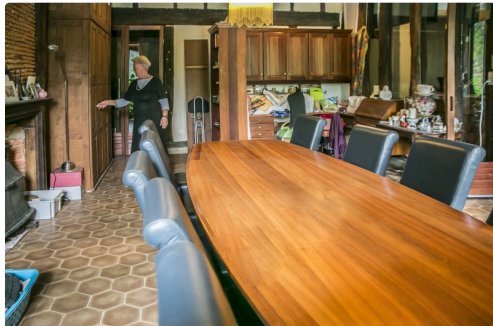
La salle à manger d'un appartement