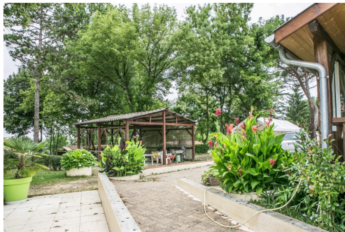
Vue de la salle à manger d'été