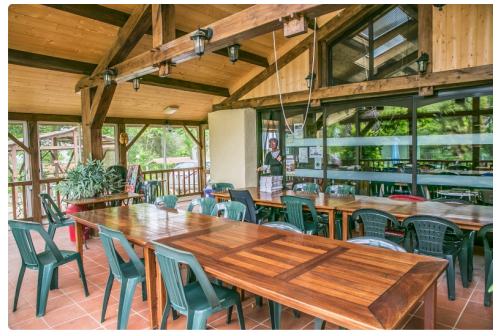
Une des salles à manger couvertes