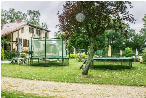
Des trampolines pour divers âges