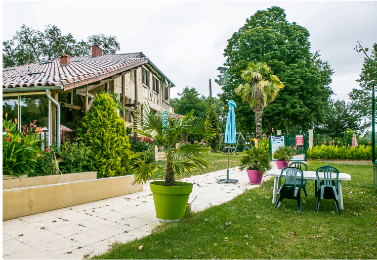
Aignan - Le domaine du Castex : une pépîte

Camping, chambres d'hôtes, chalets, mobilhomes