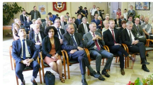
Les personnalités invitées.

Ce pacte de réciprocité que l'État encourage, le ministre Jacques Mézard, y voit une certaine forme de solidarité : « L'État et les collectivités qui vont bien, analyse-t-il, doivent se pencher sur ces territoires ruraux qui se disent fragiles et abandonnés et qui l'exprime. Il s'agit de lutter contre cela. Pour y parvenir nous devons régler un des sujets prioritaire qu'est le numérique car ce n'est pas possible que la France ait autant de retard par rapport à ses voisins ».