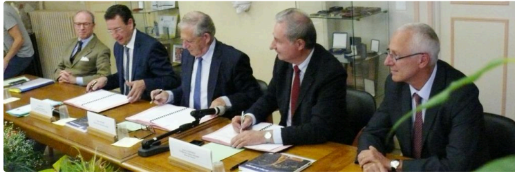
Les Portes de Gascogne et Toulouse Métropole unis par un contrat de réciprocité

Le ministre de la cohésion des territoires, Jacques Mézard, était à Fleurance pour le valider