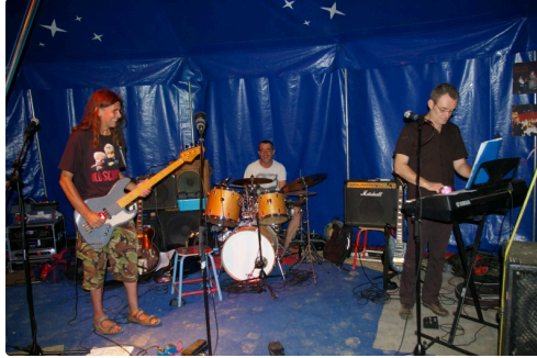
Des oreilles encore avec Gramou Vinaigrette : Douze Photos Marcel Lavedan Droits Réservés