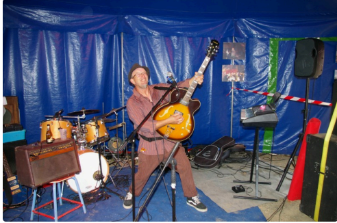
Des oreilles avec Roms'Attack