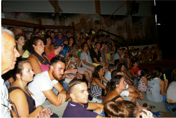
Superbes soirées d'anniversaire des vingt ans de Circ'Adour

Vendredi soir dans sa salle samedi soir sous chapiteau