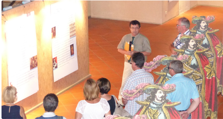
Exposition au Musée Campanaire de l'Isle-Jourdain

Photo : Michel Hue expliquant le parcours de l'exposition aux personnalités présentes au vernissage