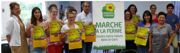
Les marchés à la ferme débutent le 1er juillet jusqu'au 24 août

Ce sont 28 marchés qui sont proposés aux gersois et aux touristes