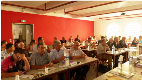
l'assistance de la chambre d'agriculture.