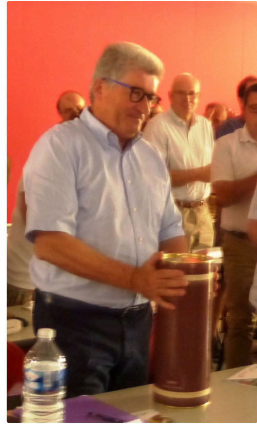
Remerciements pour l'ancien Président, avec un "petit" souvenir , un produit du chateau de Mons qui n'a rien à voir pour sûr avec la bouteille du premier plan .