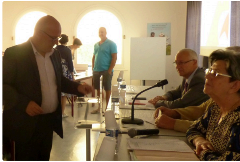
c'est l'heure du vote pour le futur Président.