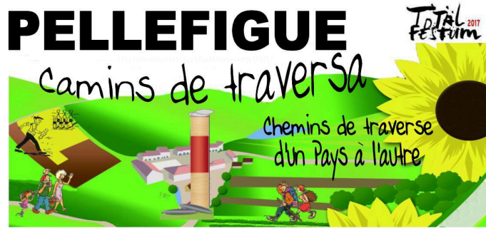
Pellefigue : Camin de traversa avec les foyers ruraux du Gers