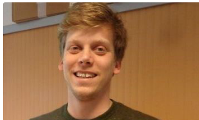
Médiathèque Municipale de Riscle

Le samedi 24 juin à 14 heures 30, en la médiathèque municipale de Riscle, Bastien Solignac, réalisateur de 28 ans, propose aux jeunes (12-18 ans) qui le souhaitent, une rencontre autour de son métier et de son projet de tournage à Riscle.